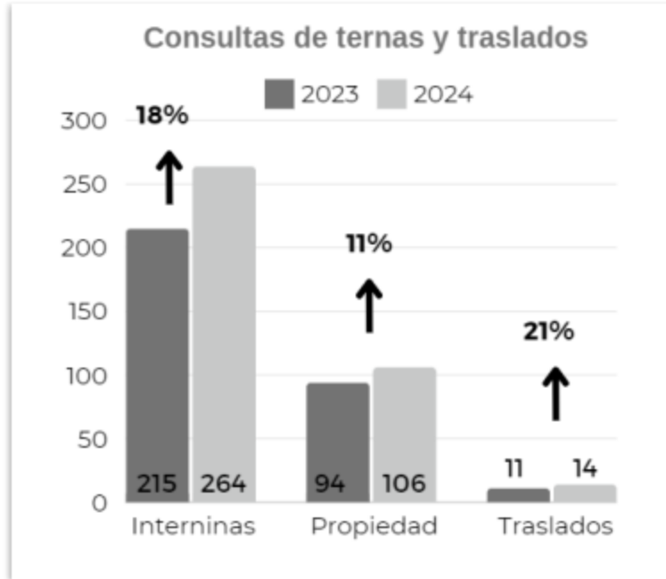
Gráfico N°3 Consultas de ternas interinas, en propiedad y traslados gestionados